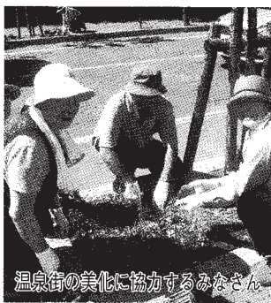
温泉街の美化に協力するみなさん

7月19日、町が推進する「魅力ある観光地づくり整備事業」の一環として、洞爺湖温泉街のメイン通りに住民など約40人が参加して400鉢の花を移植しました。移植したのは、サルビアとペロニカ。8月中にきれいに咲いた夏の花が見られるかもしれません。