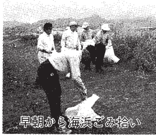
早朝から海浜ごみ拾い

7月18日の海の日、虻田町衛生協会の呼びかけで、前浜の清掃活動を行いました。当日は、約50人の住民が参加して、北海道あけぼの食品株式会社から板谷川まで約1・5kmの海浜を清掃。ゴミ袋100個(約1トン)ほどのごみを回収しました。