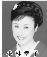
小 林 幸 子