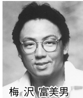
梅 沢 富 美 男