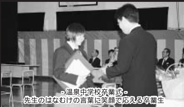
温泉中学校卒業式 先生のはなむけの言葉に笑顔で応える卒業生