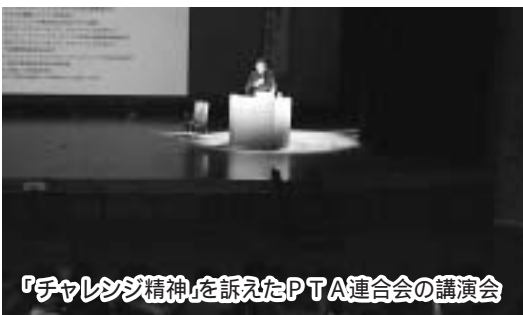
『チャレンジ精神』を訴えたPTA連合会の講演会