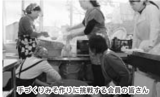
手づくりみそ作りに挑戦する会員の皆さん

このほか11月15日の「昆布の日」に合わせて、地場産品を使った沖縄風五目ごはん、昆布と野菜の和風ピクルス、