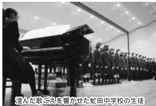
澄んだ歌ごえを響かせた虻田中学校の生徒