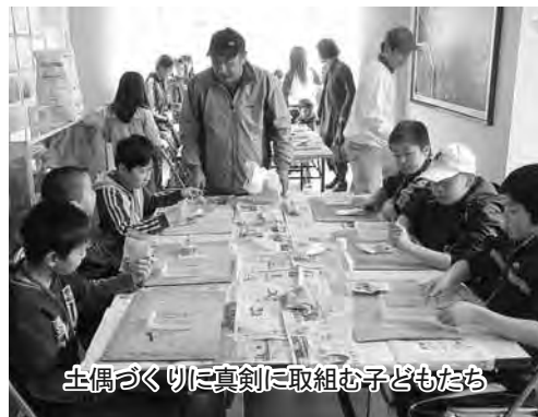
土偶づくりに真剣に取り組む子どもたち

偶野焼きを屋外で行いました。子どもたちは、各コーナーを訪れ、縄文体験を楽しみました。