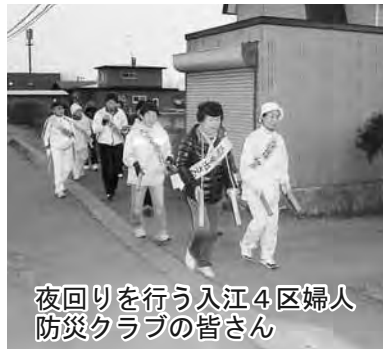
入江4区婦人防火クラブの皆さん 夜回りをを行う