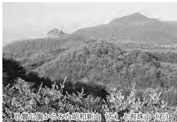
壮瞥公園からみた昭和新山(左)と有珠山(右)