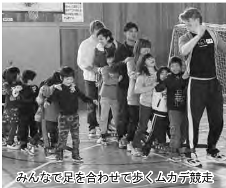
みんなで足を合わせて歩くムカデ競走

ムカデ競走やおにごっこ、カラーゲームなど盛りだくさんの遊びメニューを楽しみ、体育館に歓声が響きわたっていました。