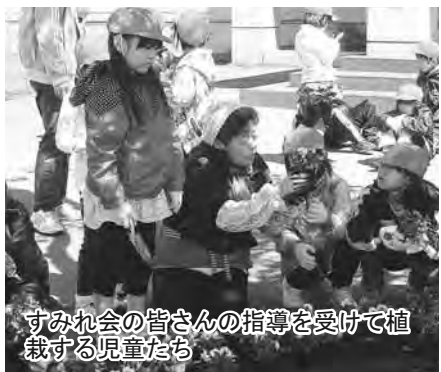
すみれ会の皆さんの指導を受けて植栽する児童たち

子どもの日の恒例行事「トーヤ子どもの日2013」が、5月5日ネイパル洞爺で行われました。