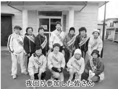
夜回り参加した皆さん