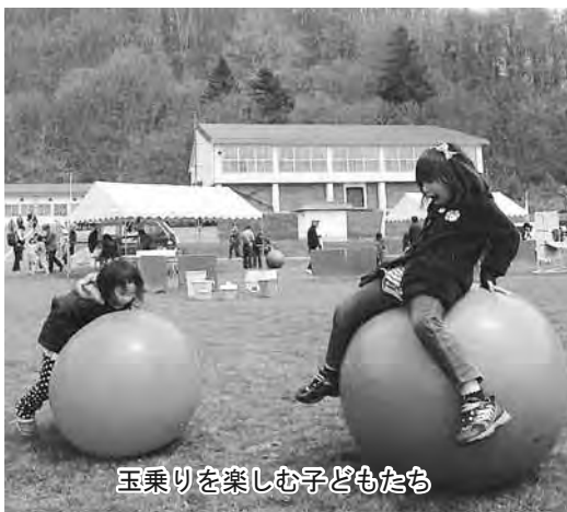
玉乗りを楽しむ子どもたち

子どもの日の恒例行事「トーヤ子どもの日2013」が、5月5日ネイパル洞爺で行われました。