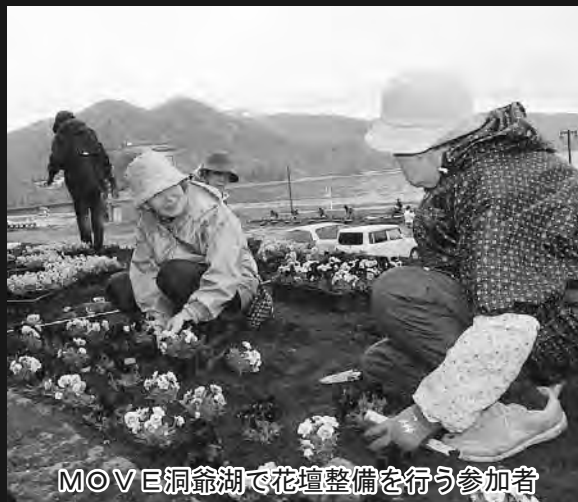
MOVE 洞爺湖で花壇整備を行う参加者