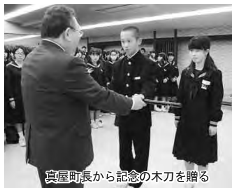
真屋町長から記念の木刀を贈る

5月15日奈良県の天理中学校が、初めて洞爺湖町を修学旅行で訪れ、宿泊先のホテルで町主催の歓迎セレモニーが行われました。天理