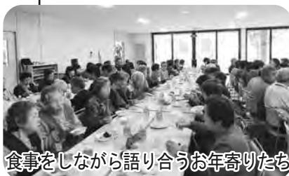
食事をしながら語り合うお年寄りたち

次回以降の送迎ボランティアを募集します。洞爺湖町社会福祉協議会(☎76-4363)へ連絡ください。