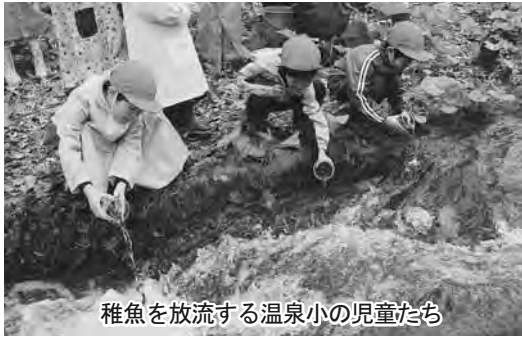
稚魚を放流する温泉小の児童たち