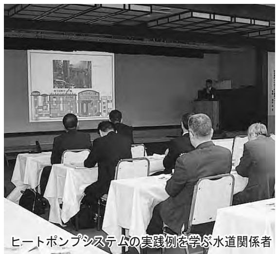
水道関係者が学ぶヒートポンプシステムの実践例

過去には、世界認定を取り消された地域もあるほど厳しい審査が行われますが、この再審査をきっかけに、「巡る」「学ぶ」「食べる」をキーワードとした新しい地域の魅力『ジオパーク』を見つめ直し、さらに磨きをかけていきたいと考えています。