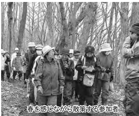
春を感じながら散歩する参加者

クリ、エゾエンゴサク、エゾノリュウキンカなどの咲き始めた野草を観察し、洞爺湖の春を満喫しました。