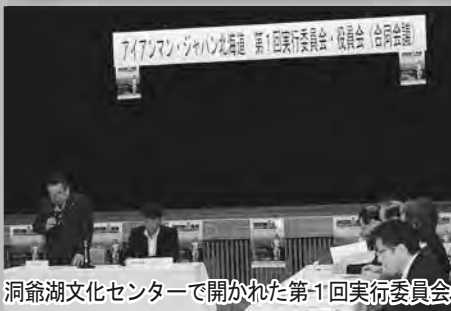
洞爺湖文化センターで開かれた第1回実行委員会

5月1日、洞爺湖文化センターで開かれた第1回の実行委員会では、同センター内に事務局を置くことが決定され、真屋町長が大会長に選出されました。