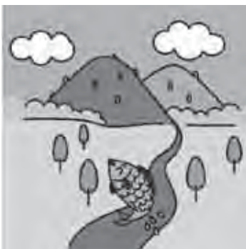
洞爺湖有珠山地域の自然

ジオパークの活動とは、大地の成り立ちから恵みまでをひとつの物語と捉え、地元の人から旅行者へ、あるいは次の世代の子どもたちへ、地域の魅力を伝えること。その主演はこの地域に住んでいる私たちです。