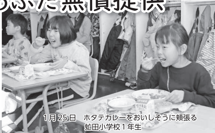
1月25日 ホタテカレーをおいしそうに頬張る 虻田小学校1年生