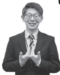
両手の背側を合わせて