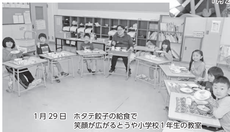
1月29日 ホタテ餃子の給食で 笑顔が広がるとうや小学校1年生の教室

町 の特産品のホタテのおいしさを児童生徒に知ってもらおうと、ホタテを使った学校給食が、学校給食週間(1月24日～30日)に合わせて、町内の全小中学校で振る舞われました。 1月25日は、虻田地区にホタテ入りカレー、洞爺地区はホタテ入りの玉子とじ丼が登場しました。