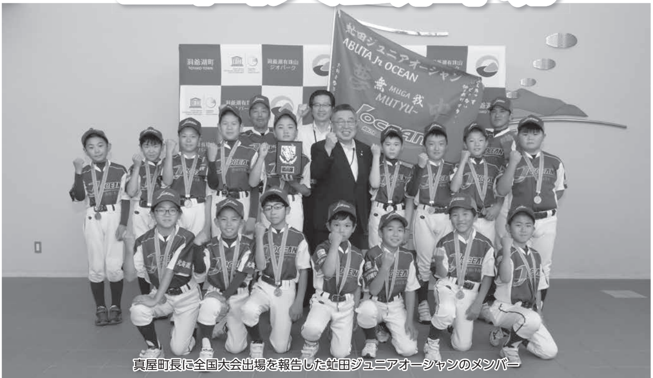
真屋町長に全国大会出場を報告した虻田ジュニアオーシャンのメンバー