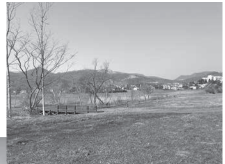
整備中の高砂貝塚