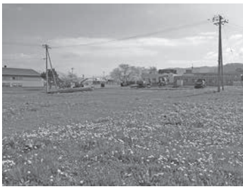
(仮称) 洞爺高校メモリアル公園整備予定地

・移住・定住促進事業(ちよつと暮らし体験住宅、婚活支援、チャレンジショップ支援)……467万円