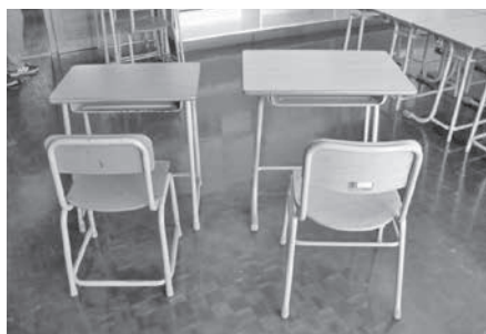
昨年更新した小学校高学年用机・椅子