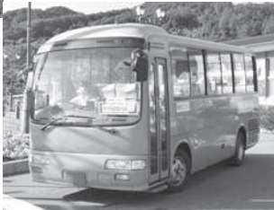
虻田地区コミュニティバス