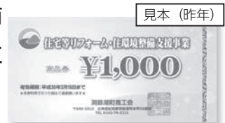
住宅リフォーム支援事業の商品券