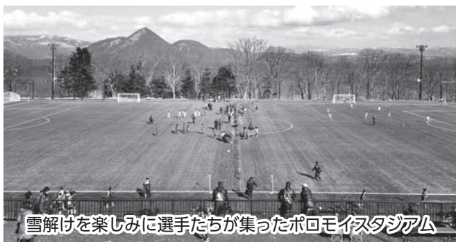
雪解けを楽しみに選手たちが集ったポロモイスタジアム

が、3カ月半ほどの閉鎖期間を終え今年も3月21日から業務を開始しました。月浦地区は、比較的雪が少ない地域といわれる洞爺湖町の中で、毎年雪が多く降り、雪解けが心配されてきた地域ですが、今年も多くの人たちの除雪の協力で、無事オープンにこぎつけました。当日は、開業時期が春休みということもあり、まだまだ雪が残っている旭川や網走など遠方からの利用者も多数訪れ、とても賑やかなオープンとなりました。