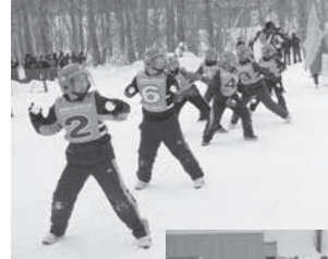
ジュニア交流戦 優勝 虻小Aシューターズ