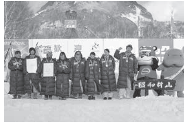
一般の部 準優勝 AS・SC レディースの部 3位 MISKY.