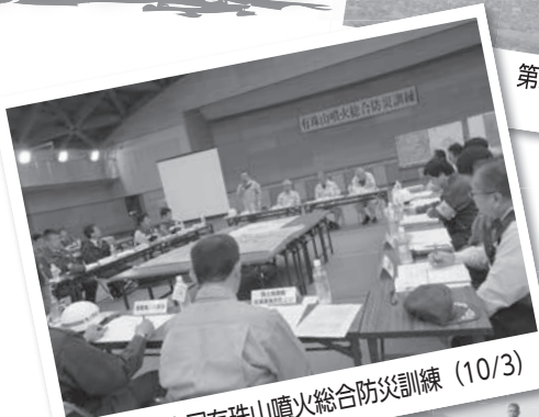
1市3町合同有珠山噴火総合防災訓練 (10/3)