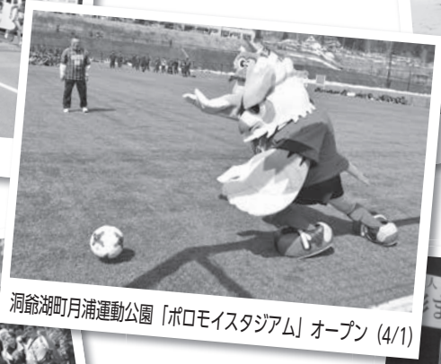
洞爺湖町月浦運動公園「ポロモイスタジアム」オープン (4/1)