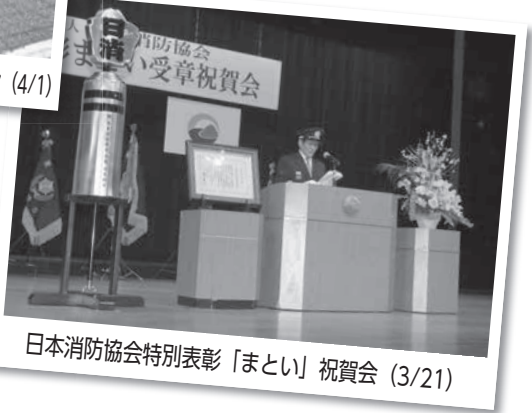
日本消防協会特別表彰「まとい」祝賀会 (3/21)