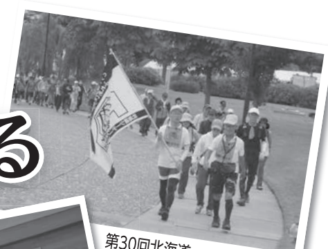
第30回北海道ツーデーマーチ (9/9～10)

皆さんにとってどんな年でしたか？平成29年の主な出来事を写真とともに振り返ります。（11月30日現在）