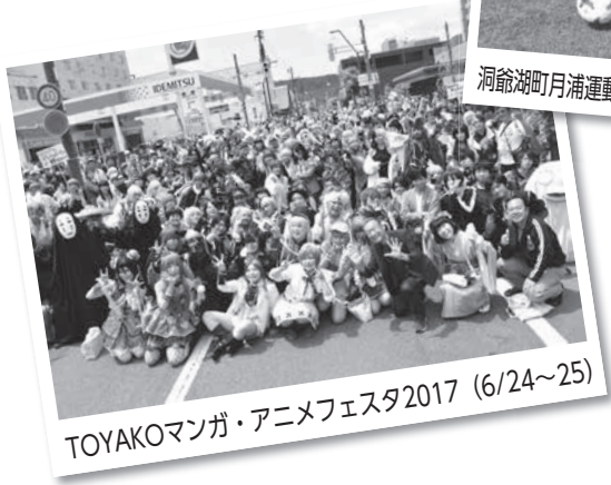
TOYAKOマンガ・アニメフェスタ2017 (6/24~25)