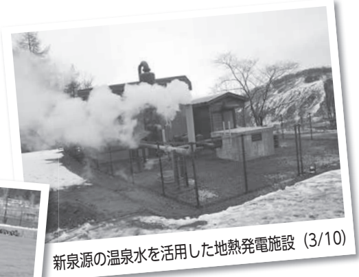
新泉源の温泉水を活用した地熱発電施設 (3/10)