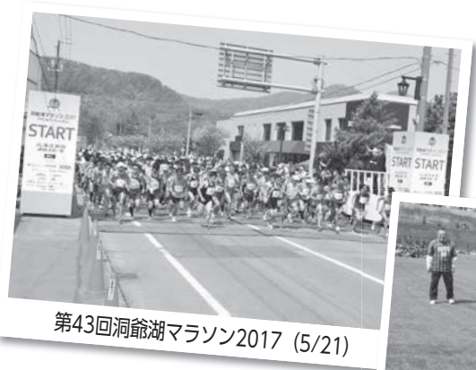
第43回洞爺湖マラソン2017 (5/21)