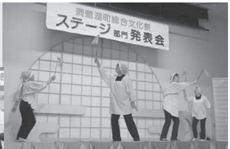
洞爺湖町総合文化祭