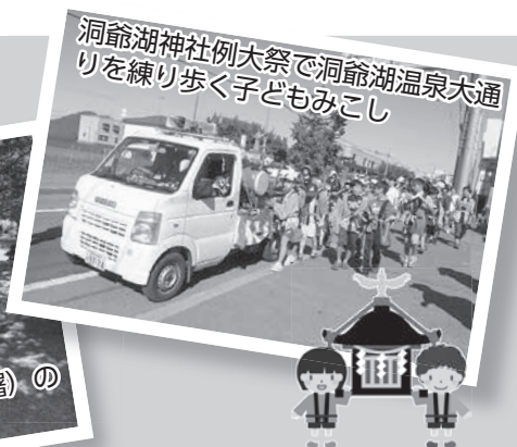
洞爺湖神社例大祭で洞爺湖温泉大通りを練り歩く子どもみこし