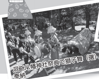
洞爺八幡神社祭典で獅子舞（曙）の奉納