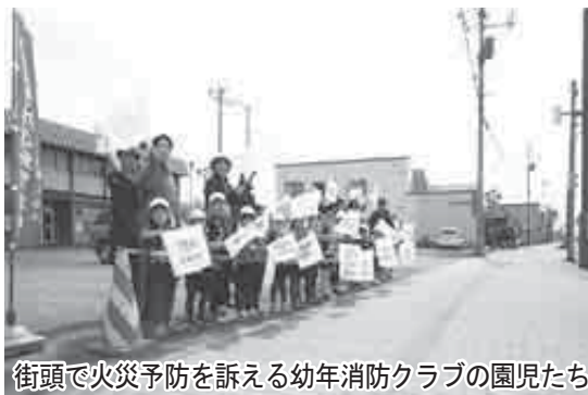
街頭で火災予防を訴える幼年消防クラブの園児たち

保育所園児、入江保育所園児、本町保育所園児、とうやこ幼稚園園児）が、街頭で女性消防団員と一緒に「火の用心」を合言葉に火災予防を呼びかけました。