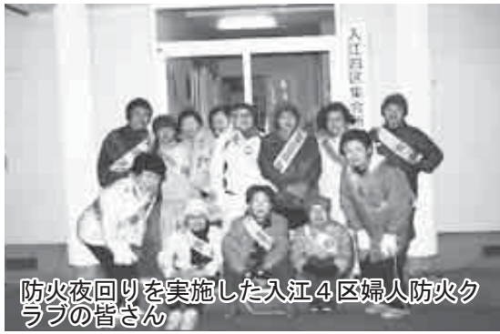
防火夜回りを実施した入江4区婦人防火クラブの皆さん

保育所園児、入江保育所園児、本町保育所園児、とうやこ幼稚園園児）が、街頭で女性消防団員と一緒に「火の用心」を合言葉に火災予防を呼びかけました。