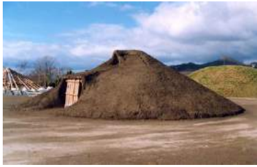
入江・高砂 貝塚公園