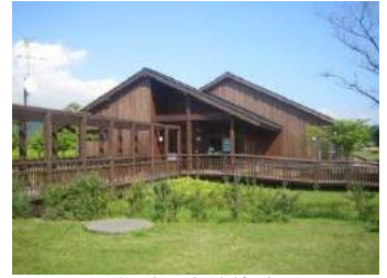
洞爺財田自然体験ハウス