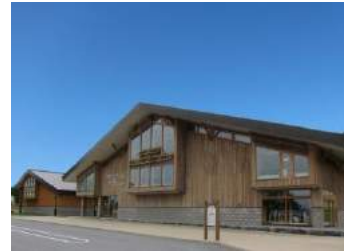
洞爺湖ビジターセンター・火山科学館