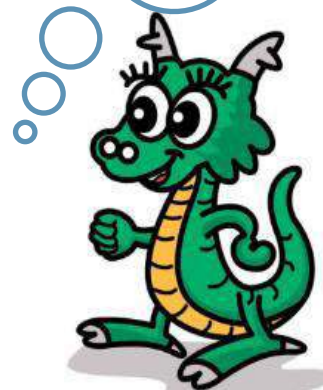
洞爺湖町マスコットキャラクター 「洞龍くん」(とうろん)