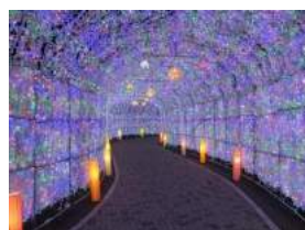
イルミネーショントンネル