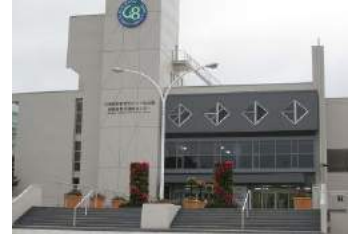
洞爺湖サミット記念館