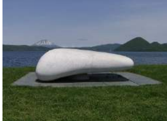
とうや湖ぐるっと彫刻公園