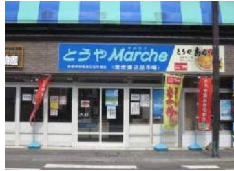
とうやMarche 洞爺湖温泉36番地 0142-75-3833